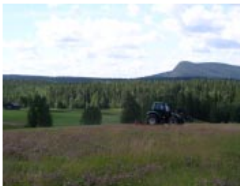
Vy över trean.

Förutsättningarna har inte varit dom bästa för det har legat 7-8 cm is under snön på alla kortklippa