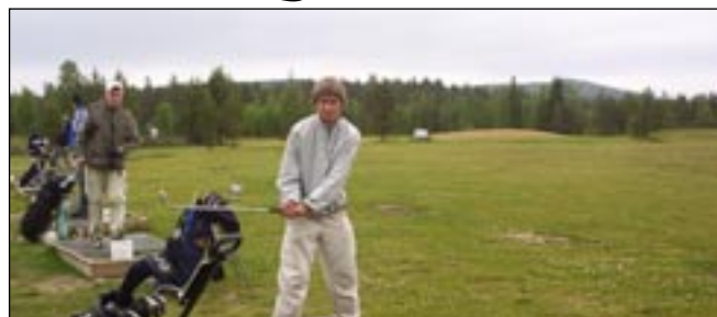
Den praktiska delen av utbildningen sker på rangen.

Spelet från gulsvarta tees kommer enbart att göras på hål 1-9. Vi bedömer att några av de nya hålen (t. ex. nr 16) är alltför svåra för nybörjare. Gulsvart tee är märkt med en platta på fairway och vi kom-