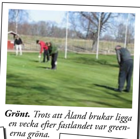
Grönt. Trots att Åland brukar ligga en vecka efter fastlandet var greenerna gröna.