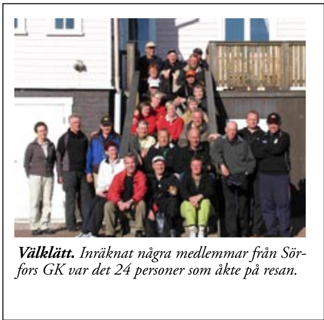
Välklätt. Inräknat några medlemmar från Sörfors GK var det 24 personer som åkte på resan.