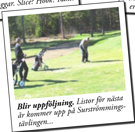
Blir uppföljning. Lister för nästa år kommer upp på Surströmmings-tävlingen...