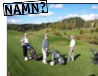
Hål 13. Par 5. Lutar nedför.