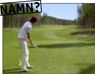
Hål 10. Par 5. Rakt, platt.

Banguiden kommer att successivt växa fram på hemsidan, och ska även finnas upptryckt under säsongen.