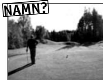
Hål 11. Par 3. Lätt skymd sikt.