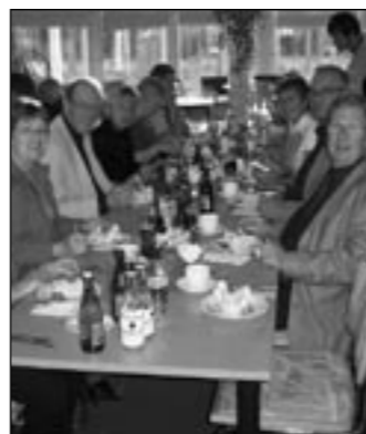
Det kommer att erbjudas fika i restaurangen.