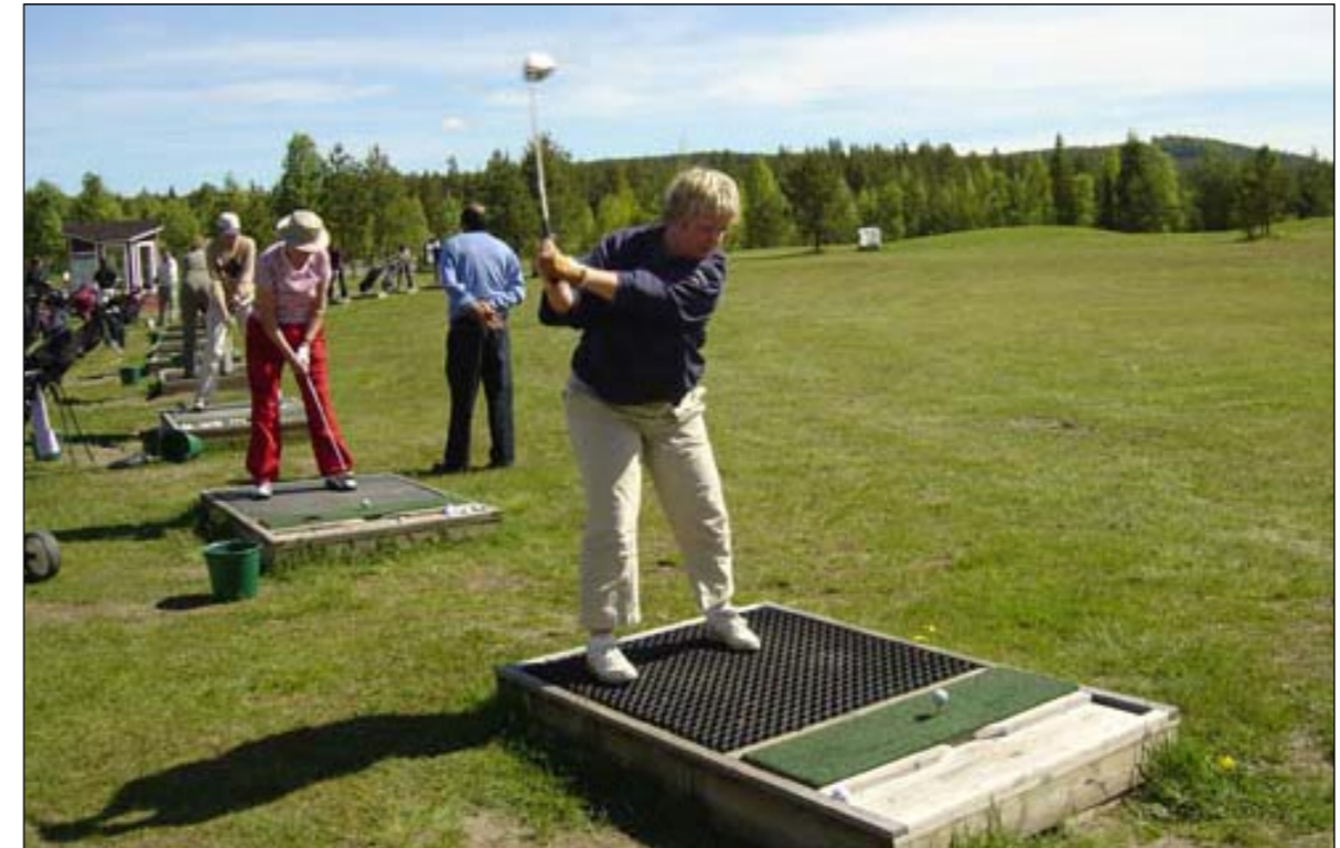
Nöta, nöta. Under damläger-helgen finns det mycket tid till träning på rangen. Gamal instruerar.