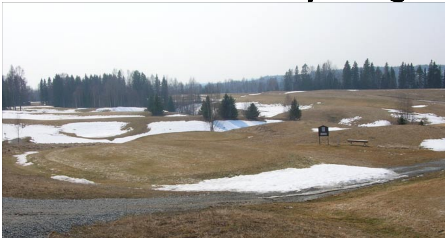
Den ovanligt snörika avslutningen på vintern gjorde att stora delar av banan var snötäckt ända in i maj. Denna bild är tagen fjärde maj.