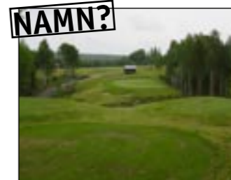
Hål 16. Par 3. Ravin & plataer.