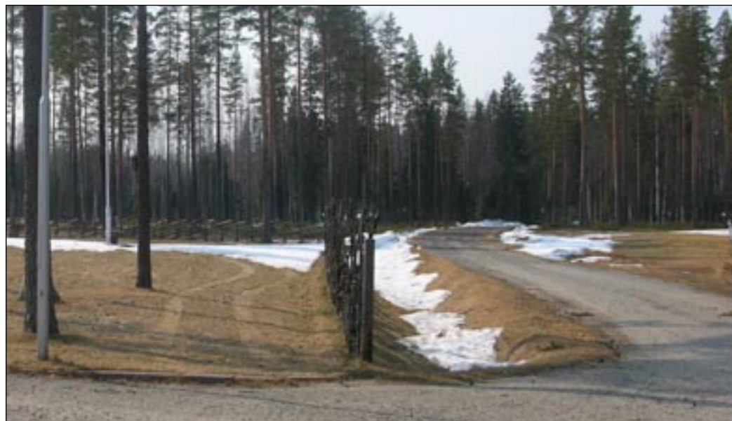
Vägen dit. Mellan nians och artons greener går en väg in, alltså precis vid klubbhuset. En bit in här kan det bli stugbygge.