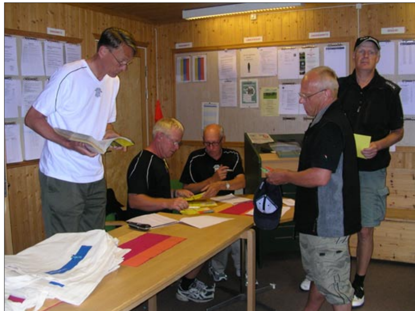
Här, i anslutning till kansliet, kommer en ny reception att byggas under sommaren. Där kommer man också kunna betala greenfee med kreditkort.