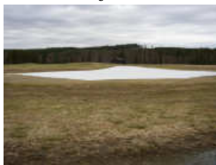
6 maj: Övningsgreen under täckduk