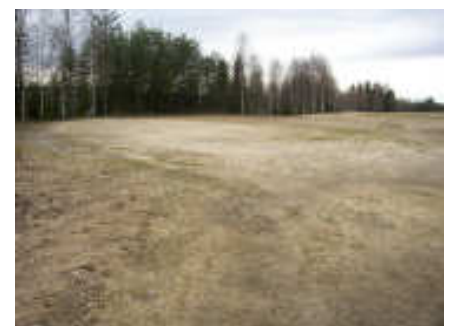
6 maj: Gul tee på hål 13