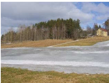
3 april: Green 14 med istäcke

Vi har dock inte de personella resurserna att klara av detta, så i år är det extra viktigt att de ideella insatserna organiseras och