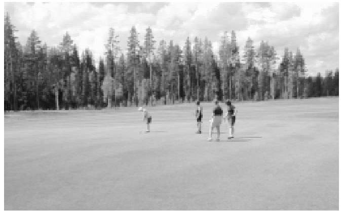
Nervpirrande putt på det sista hålet. Birdie?