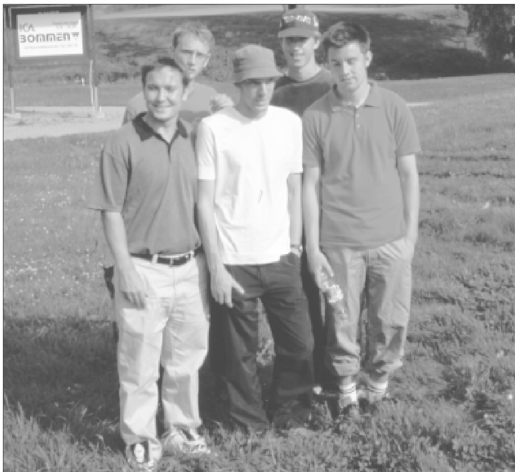
Bilden: Bjurholms GKs Elitlag vid division 2 sammandraget på Öjestrands GK.