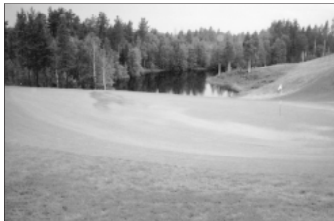
5:ans green, blöt och fin.