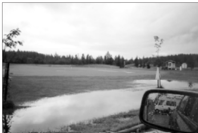
Ja, det är övningsgreenen...