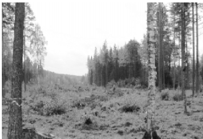
Hål 10 sett från klubbhuset. Par 5, smal skogskorridor. Mynnar ut på åkern i kurvan.