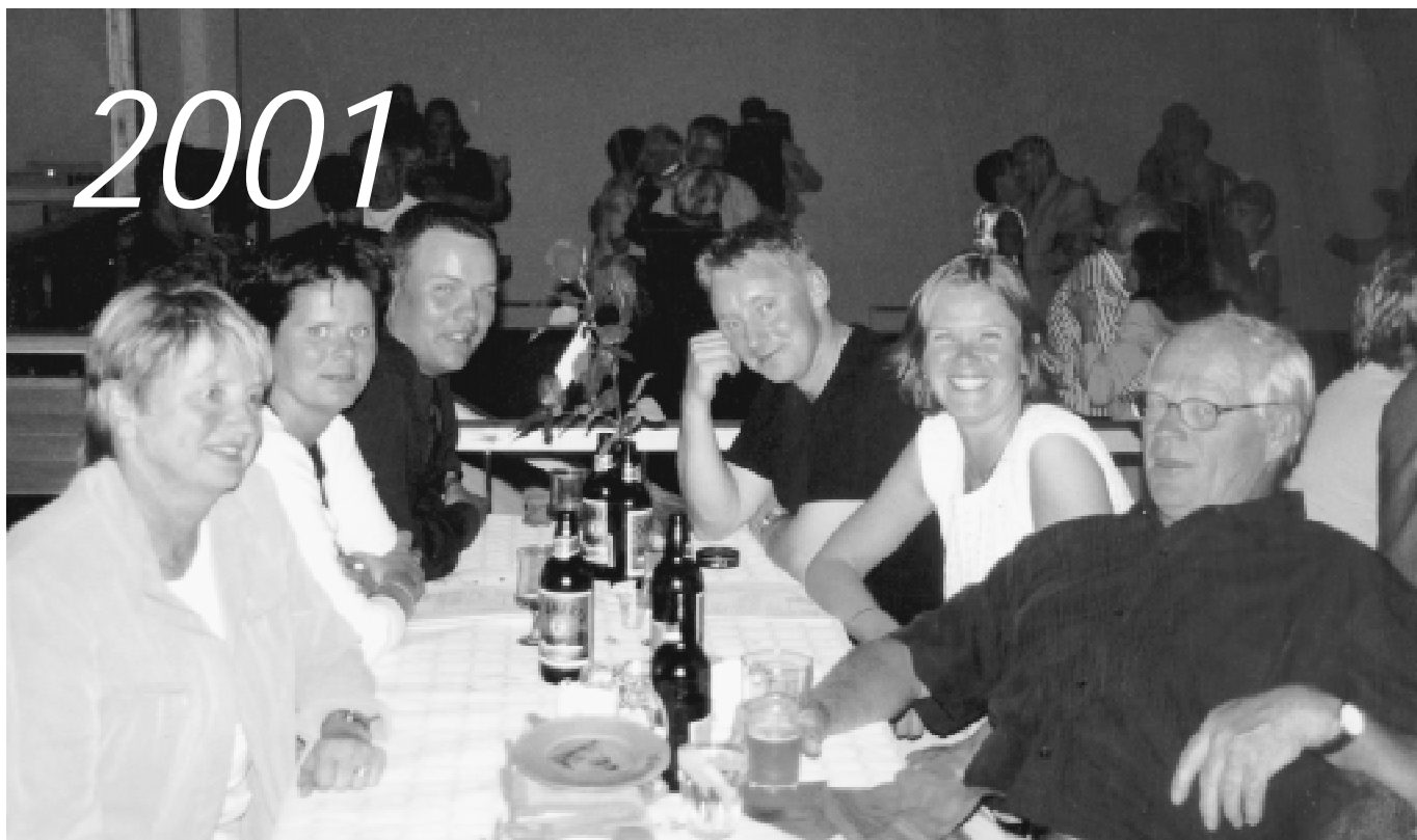
På kvällen var det kalas. Trevliga samtal och virvlande dans var några av aktiviteterna.