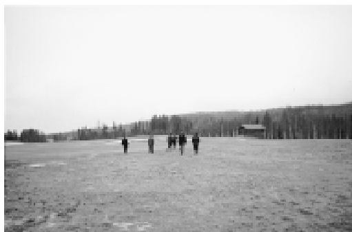
Bankkommittén på besiktning den första maj. Greenerna såddes sedan fyra dagar senare.