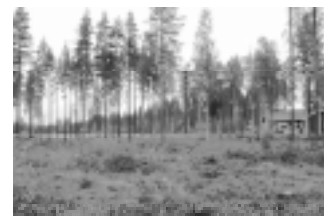
18:e hålets green.