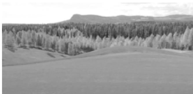
Balberget med treans green i förgrunden.