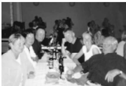
Ovan: Glada festdeltagare på folkets hus.