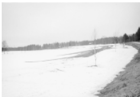
Den 27 maj var det vitt igen.