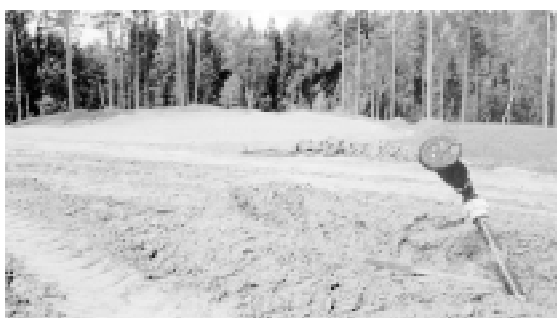
På de nya hålen installeras högtalarsystem ... näe, skämt åsido, – automatisk bevattning.

– alla tillhör de Nordwalls nära och kära. Allt sker i ett samspel med naturens förutsättningar. Banbygge är något som kräver tid och omsorg.