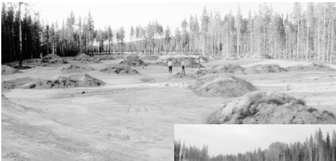
Mitt bland mullvadshögarna står patrullen från klubben. Hålet är det sista, vars fairway ligger parallellt med ...