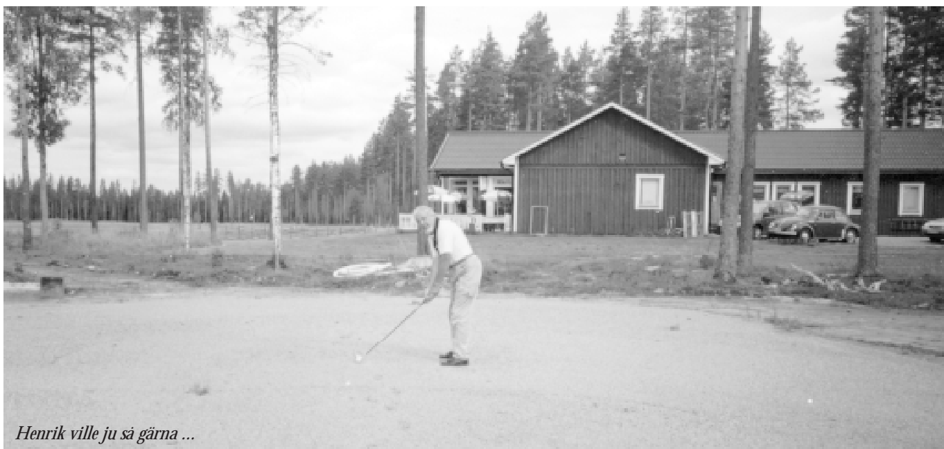
Henrik ville ju så gärna ...