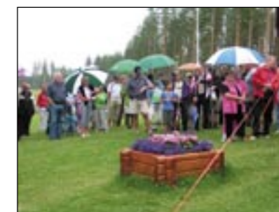
Vädret hade sett bra ut under veckan, men lagom till lördagen var det par-ply-dags.