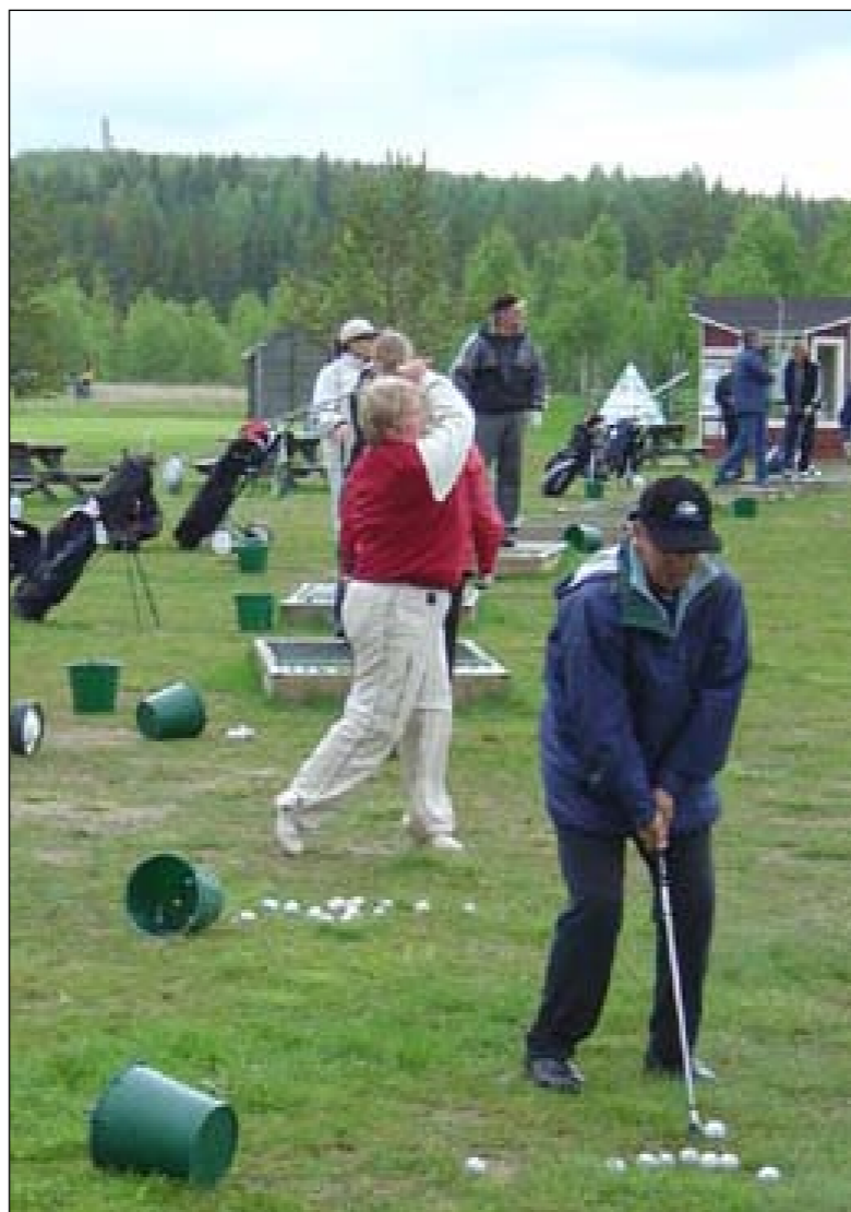
På lägreträning får alla en bra genomgång av tidigare problem.