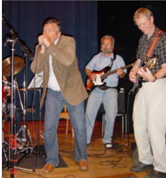
Spelemannen, skådespelaren, berättaren, storljugarn och golfaren Greger Ottosson plockade fram munspelet.