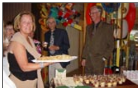
Vid ankomst bjöds det på drink och tilltugg.