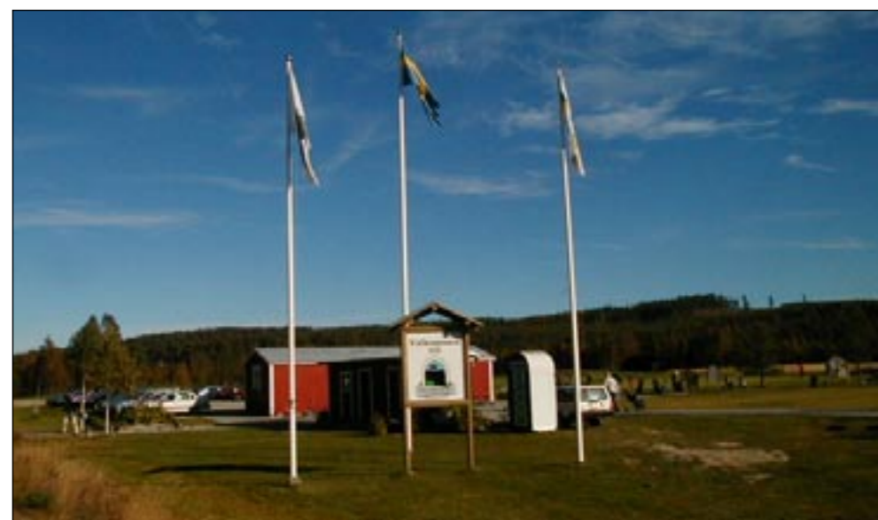
Övningsområdet har också fått ny form efterhand i sommar.