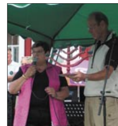
Av Bjurholms kommun fick golfklubben en “Bjurholmsstake” målad i kommunens färger.