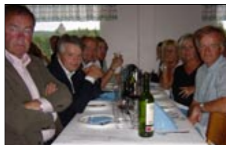
Efter en heldag på banan var det skönt att sitta ner. Vin, mat, bröd – och bröder...