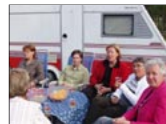
På kvällen under lägret blev det mingel på campingen.