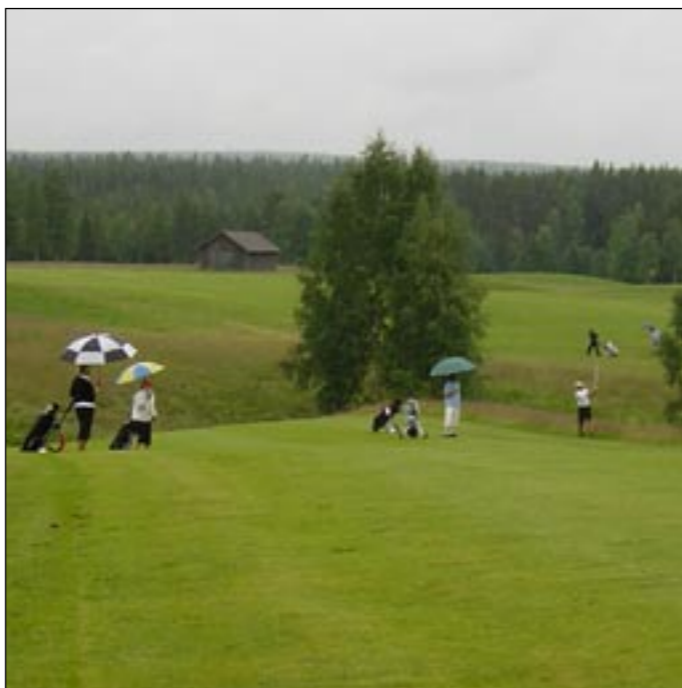
Inspelet på trean kan bli lättare för greenfeespelare om en 100-märkning placeras ut.