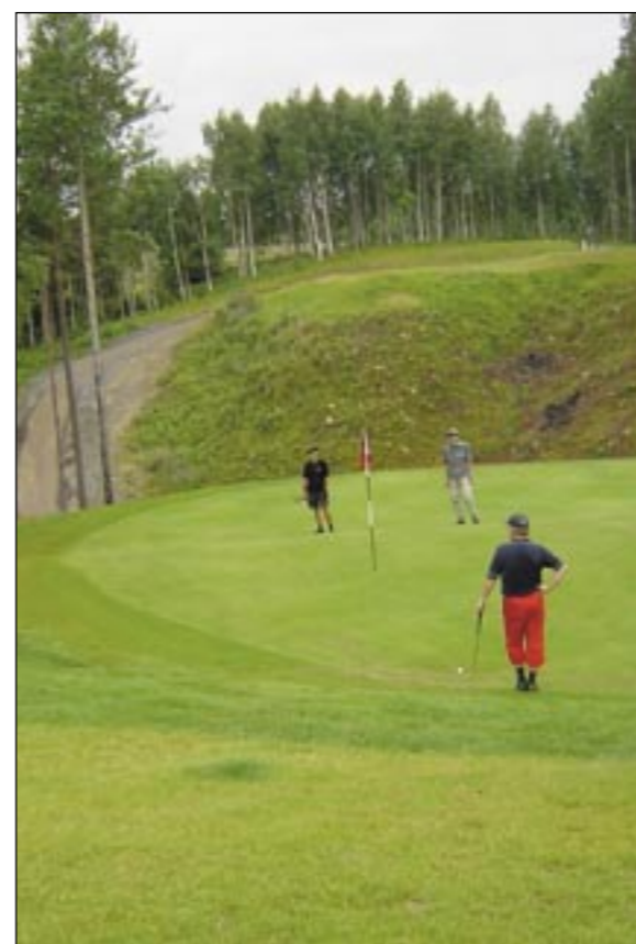
Först gäller det att träffa av greenplattan på hål 16, sedan att slå en väl avvägd putt.