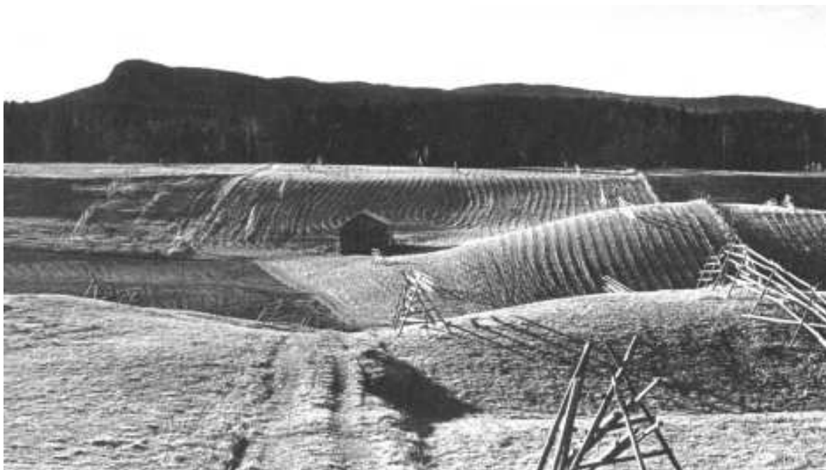
1972: Jordbruksbygd