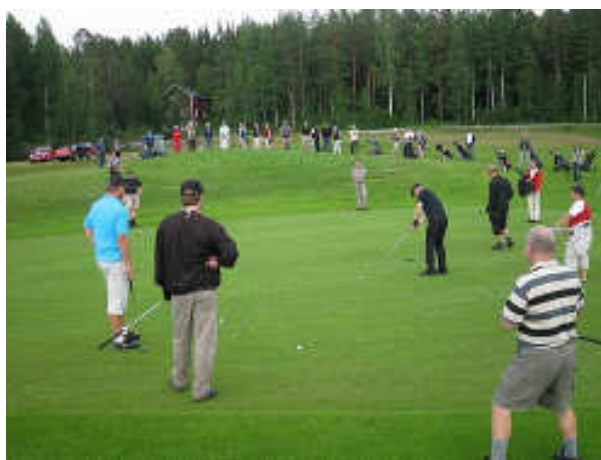
Bjurholmsscutton: Puttning på hål 3