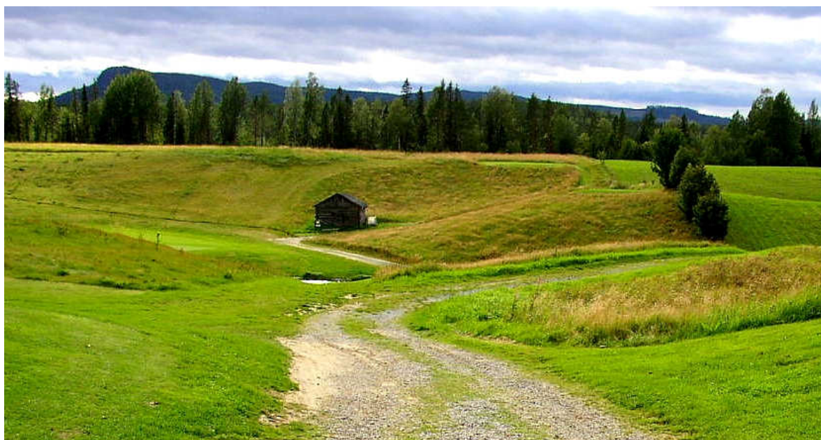
2007: En vacker golfbana har smugit sig in i bilden...